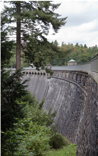
Wipperfürth-Großblumberg, Neyetalsperre, Staumauer (2014)