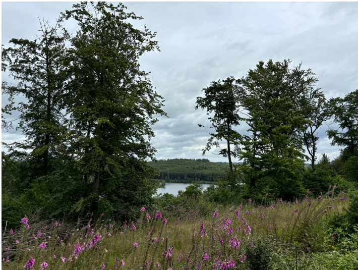
Wasserschutzzone an der Kerspitalsperre (2024)