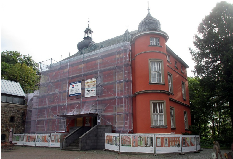
Ansicht des in Renovierung befindlichen Hauptgebäudes von Burg Wissem in Troisdorf (2016).