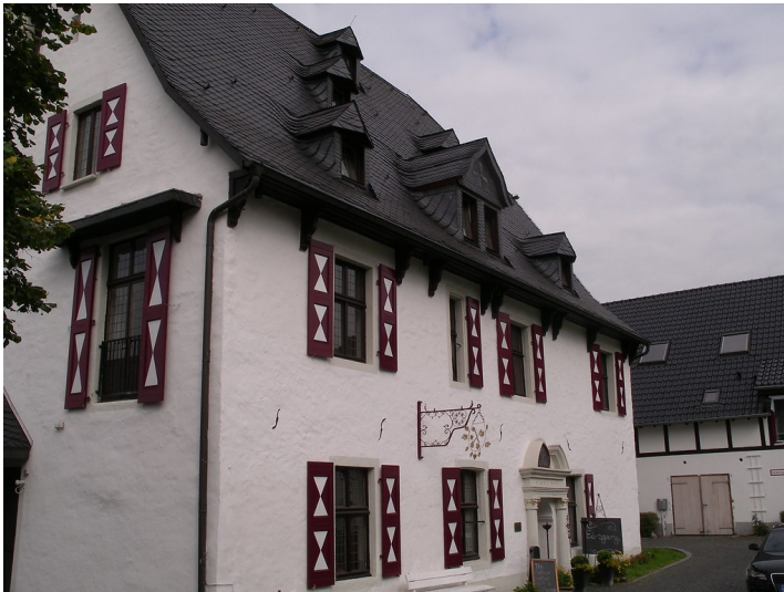
Malteserkomturei in Herrenstrunden