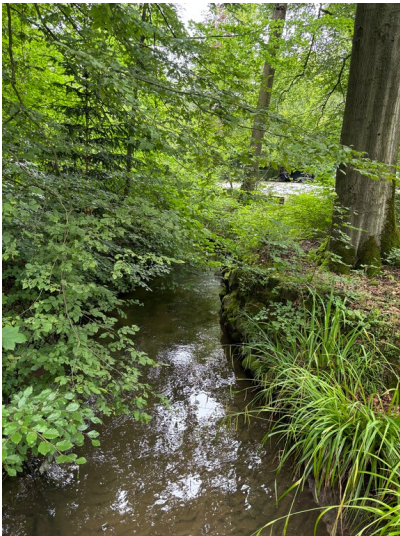
Mutzbach bei der Diepeschrather Mühle (2024)