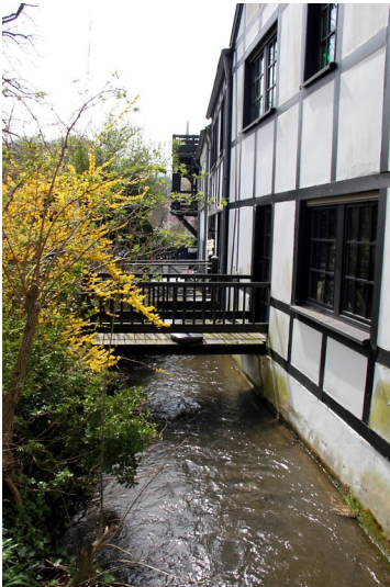
Strunde mit der Wichheimer Mühle in Köln-Holweide (2015).