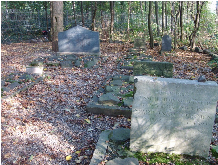
Jüdischer Friedhof Gartenweg in Köln-Zündorf (2011)