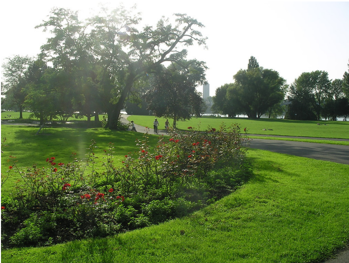
Der Rheinpark in Köln-Deutz