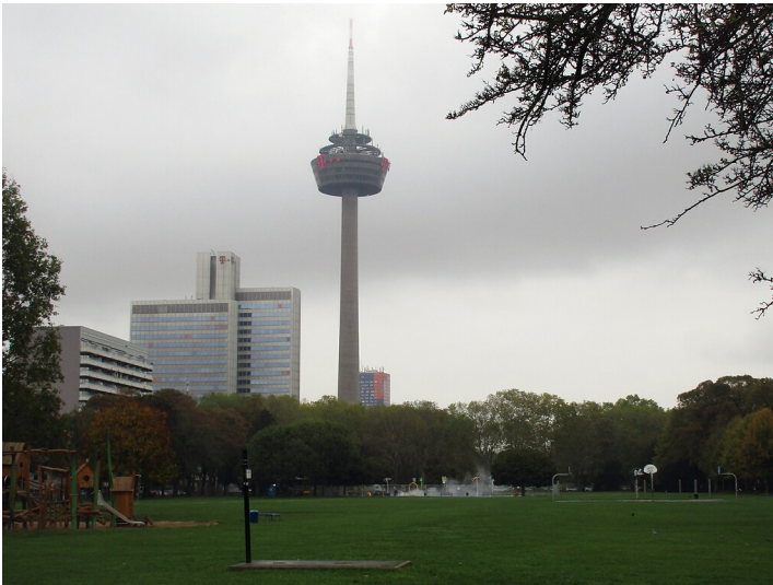
Der Fernmeldeturm "Colonius" in Neustadt-Nord, Ansicht vom Inneren Grüngürtel im Bereich der Venloer Straße (2020).