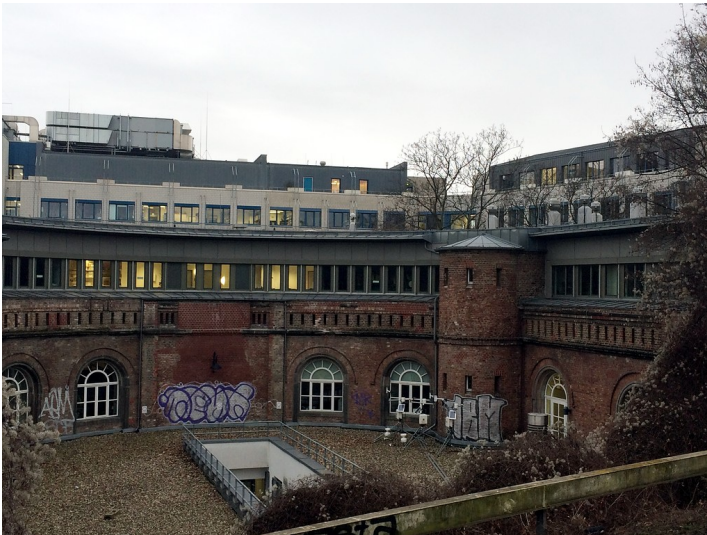
Rückseite des ehemaligen Forts V im Inneren Grüngürtel in Köln (2016)