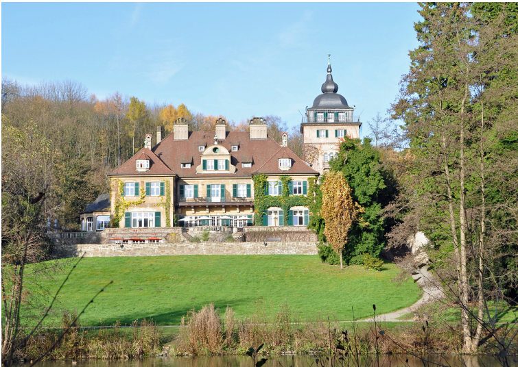
Schlossartige Fabrikantenvilla in Lerbach (2014)