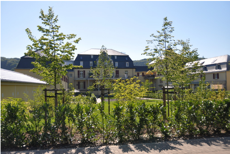
Haus Venauen (2015)