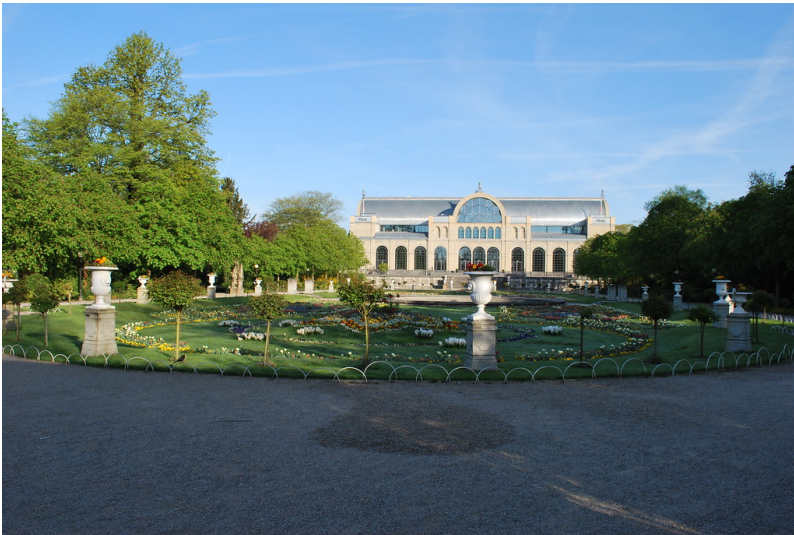
Gebäude der Flora in Köln (2015)