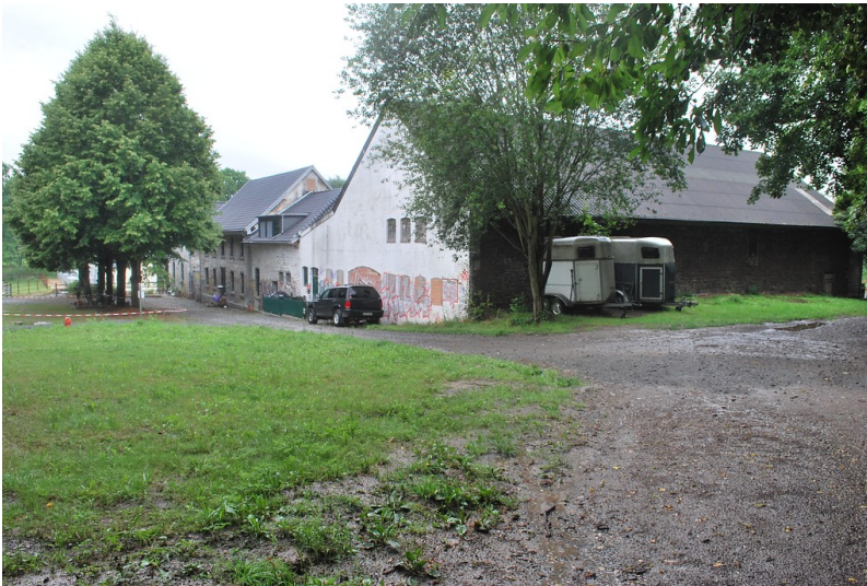
Gut Scheuerhof (2014)