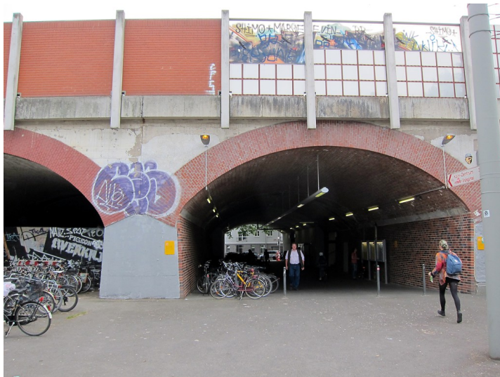
Östlicher Zugang zum Bahnhof Köln-Ehrenfeld an der Ecke Ehrenfeldgürtel/Hüttenstraße (2015). Für den Zugang wurde eines der Gewölbe der Viaduktbrücke, auf der die Bahnstrecke hier verläuft, saniert und geöffnet.