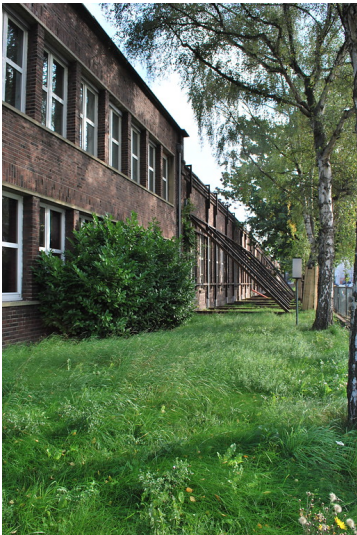
Denkmalgeschützte Fassaden Niehler Straße (2014)