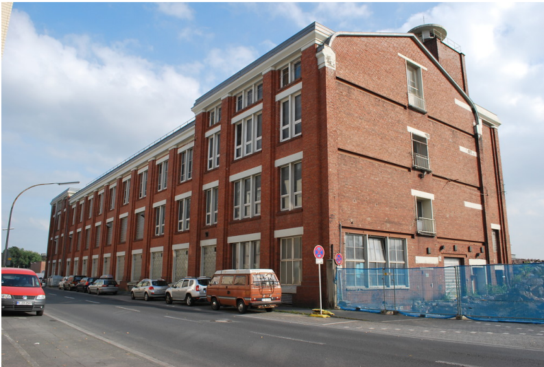
Gummifabrik Clouth von 1925/26, Halle 18 an der Xantener Straße in Köln-Nippes (2014).