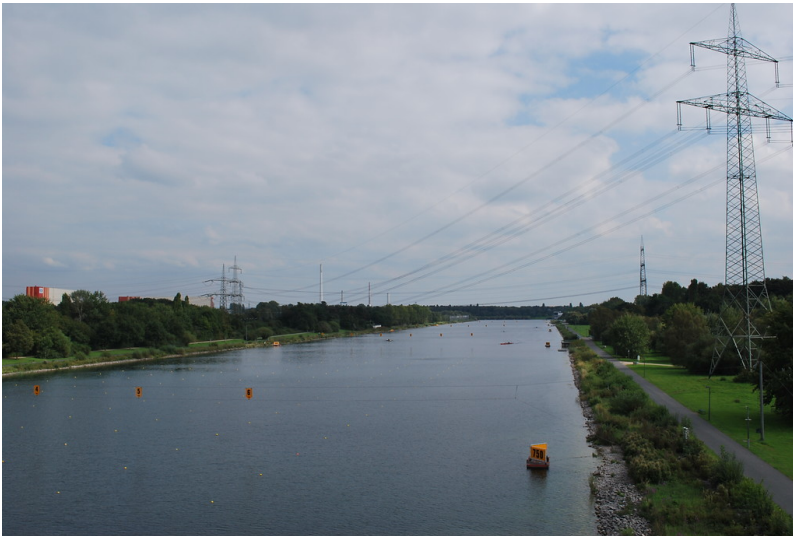
Regattastrecke Fühlinger See (2014)