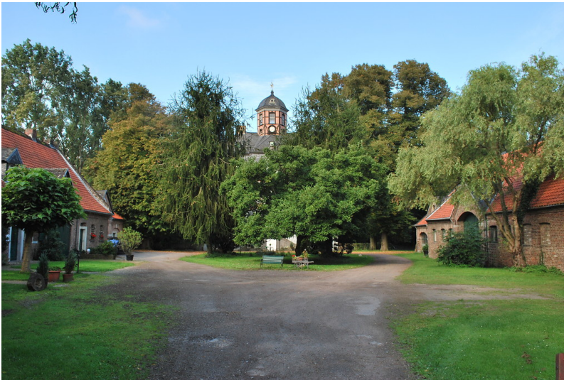
Eingangsbereich von Schloss Arff (2014)