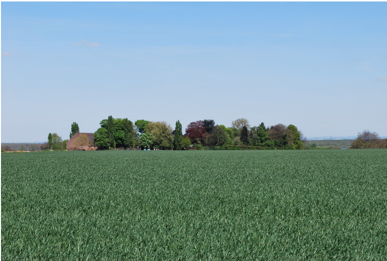
Gut Vinkenpütz, Ansicht von Westen (2014)