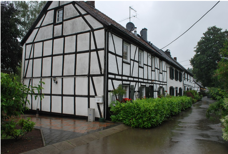
Arbeiterhäuser in der Siedlung "Am Kunstfeld" (2014)