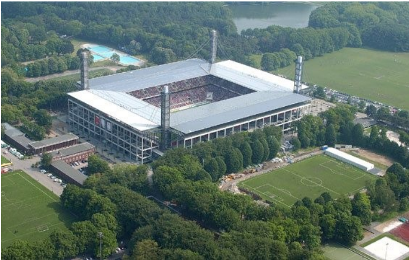
Luftbild des Sportparks Müngersdorf mit dem neuen RheinEnergie-Stadion (2012).