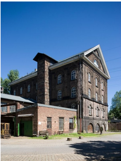
Reuschenberger Mühle