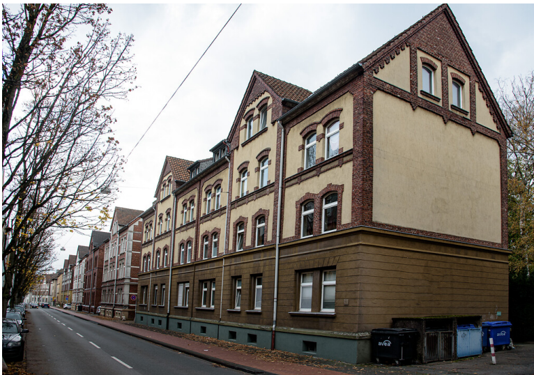
Reihenhäuser der Eisenbahnersiedlung in Opladen (2021)