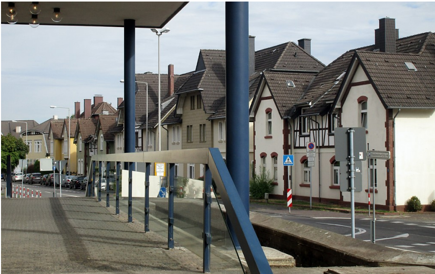
Blick auf Teile der Bayer Werkssiedlung in Leverkusen-Wiesdorf im Bereich der Nobelstraße (2018)