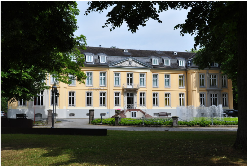
Vorderansicht Schloss Morsbroich (2015)