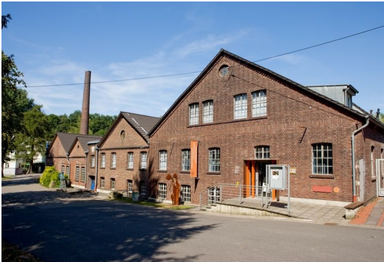
Freudenthaler Sensenhammer