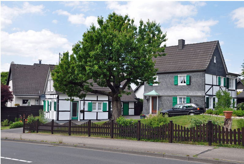
Fachwerkhäuser in Imbach (2015)