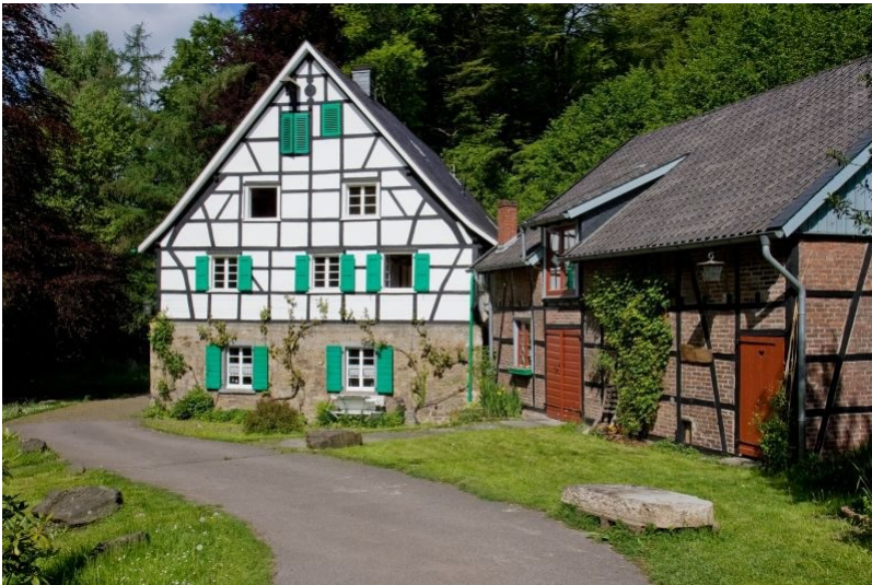
Blick auf die zwei Fachwerkgebäude der Lamberstmühle vom asphaltierten Weg aus, der links am höheren weißen Fachwerkhäuser vorbei führt. Das rechte Gebäude ist ein Fachwerk/Backstein-Bau mit einem zweiteiligen Holztür.