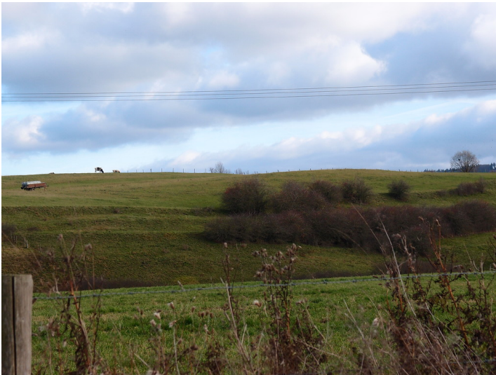
Ackerterrassen bei Freilingen mit linearen Gehölzformationen parallel zur Hangkante (2015).