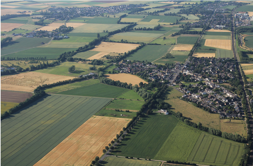
Erftmühlenbach und Erft bei Wüschheim (2015)