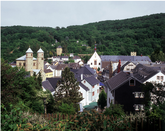
Bad Münstereifel, Stadtansicht