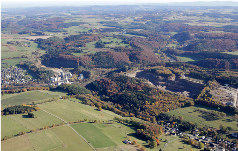
Kalksteinbruch und Kalkwerk südlich von Sötenich (2016)