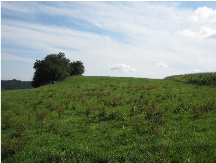
Ackerterrassen bei Bouderath mit linearen Gehölzformationen parallel zur Hangkante (2015).