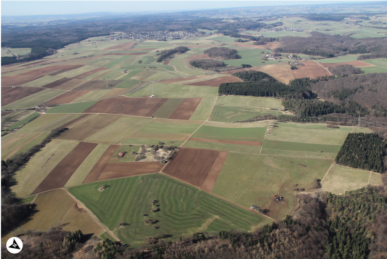
Luftbildaufnahme auf die Hochfläche bei Barhaus (mit Nordpfeil, 2013)