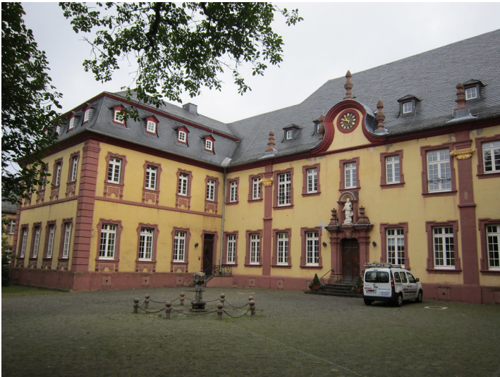
Das ehemalige Abteigebäude Steinfeld mit Abteihof (2013).