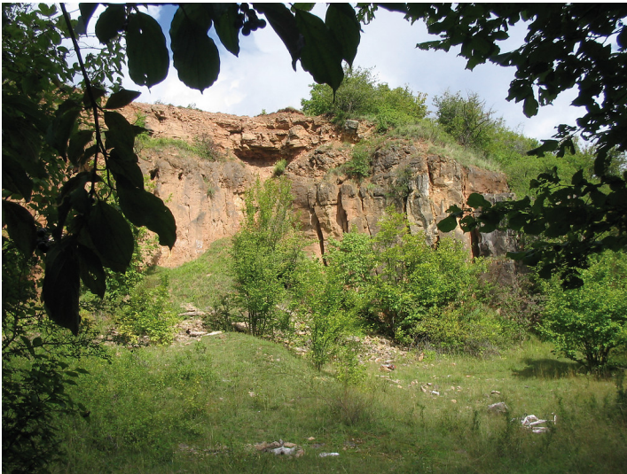
Römische Kalkbrennerei in Iversheim (2006)