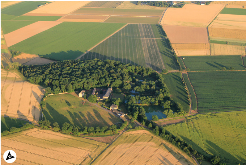
Luftbildaufnahme auf Gut Capellen in Dünstekoven mit Nordpfeil (2017)