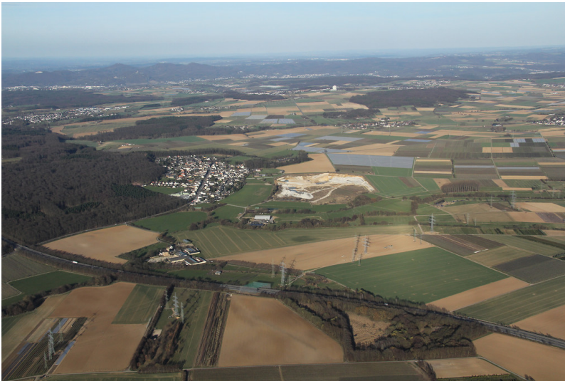
Burg Münchhausen bei Adendorf (2013)

Bundesland: Nordrhein-Westfalen, Rheinland-Pfalz