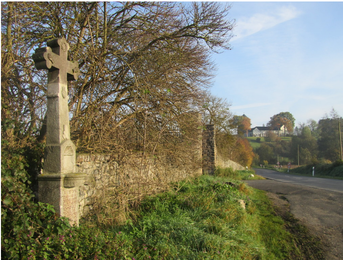
Villiper Windmühlenturm und Windmühlenhof in exponierter Lage (2014)