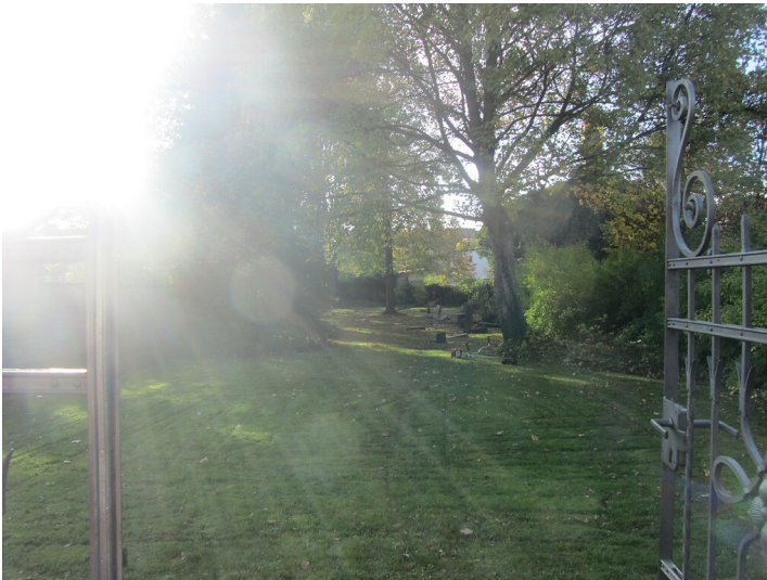
Blick durch das schmiedeeiserne Tor auf den Jüdischen Friedhof Rheinbach (2014)