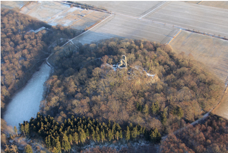
Tomburg im Rheinbacher Stadtwald (2012)