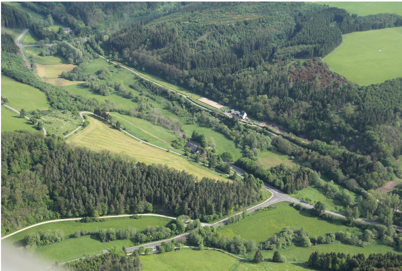
Ehemaliger Bahnhof Freilingen der Bahntrasse von Blankenheim-Wald nach Ahrdorf (2012)