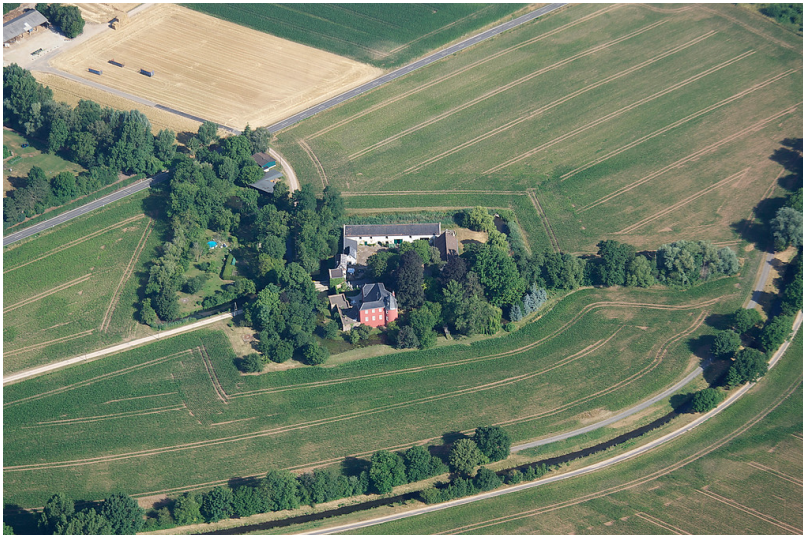
Burg Kessenich (2010)