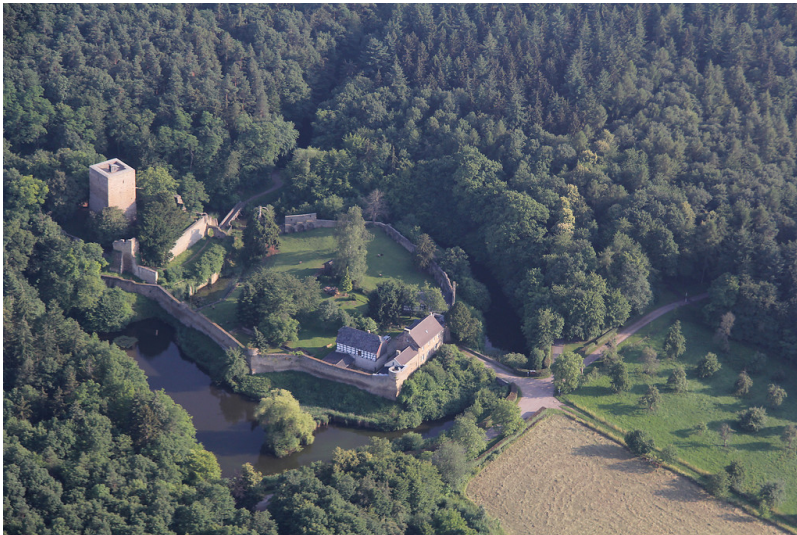
Hardtburg bei Euskirchen von Norden (2011)