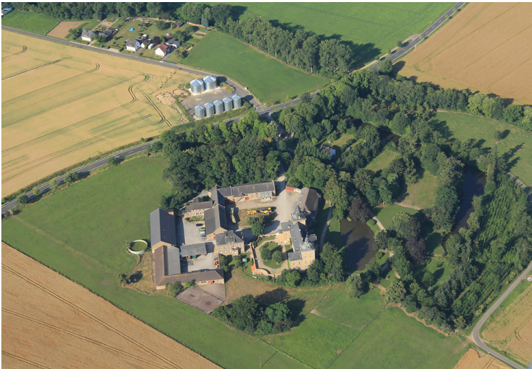
Burg Ringsheim von Süden (2013)