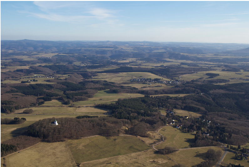
Michelsberg mit Kapelle St. Michael (2015)