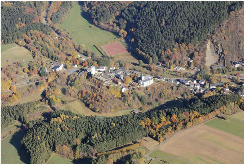
Reifferscheid von Südwesten (2016)