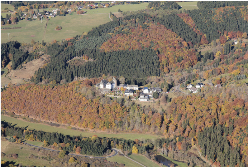
Wildenburg (2016)