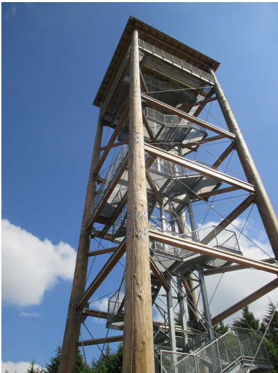
Mit vier Baumstämmen erbauter Aussichtsturm am Weißen Stein (2015)