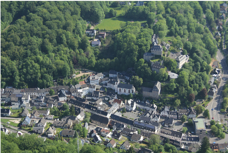
Höhenburg und Burgflecken Blankenheim von Südwesten (2012)